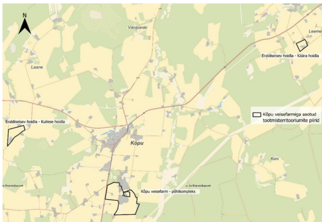
Joonis 1. Kõpu veisefarmiga seotud tootmisterritooriumite asukohad (aluskaart: Maa- ja Ruumiamet).

KMH viiakse läbi kompleksloa (tegevusloa) andmise üle otsuse tegemiseks, sh loatingimuste määramiseks. KMH käigus hinnatakse kavandatava tegevuse ja selle alternatiivide mõju keskkonnale, tuuakse välja selle olulisus ning võimalikud leevendusmeetmed negatiivse mõju vähendamiseks või vältimiseks. Keskkonnamõju hindab KMH juhtekspert ja eksperdirühm koos arendajaga.